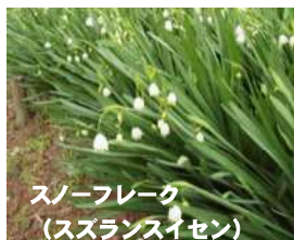
スノーフレーク (スズランスイセン)