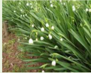
(スズランスイセン)