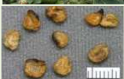
チョウセンアサガオの種