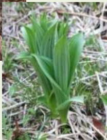
芽出し期のコバイケイソウ