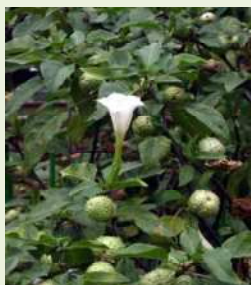
チョウセンアサガオの葉と花