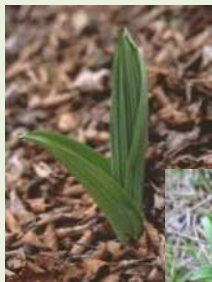
芽出し期のバイケイソウ