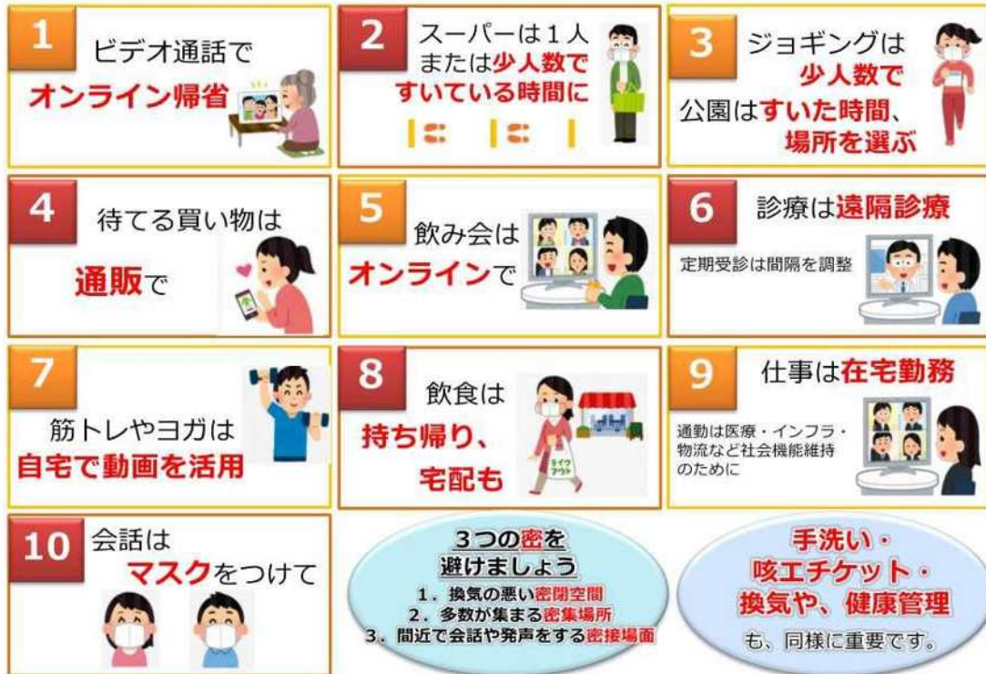
図1 人との接触を8割減らす、10のポイント

緊急事態宣言の中、誰もが感染するリスク、誰でも感染させるリスクがあります。 新型コロナウイルス感染症から、あなたと身近な人の命を守るよう、日常生活を見直してみましょう。