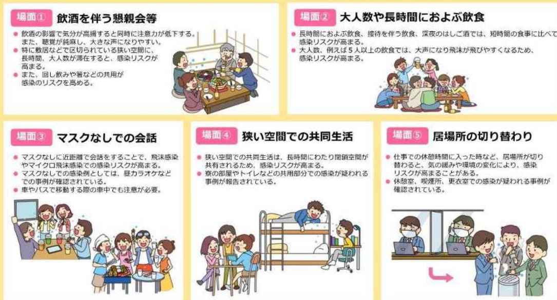
図2 感染リスクが高まる「5つの場面」（内閣官房のウェブサイトより一部抜粋）