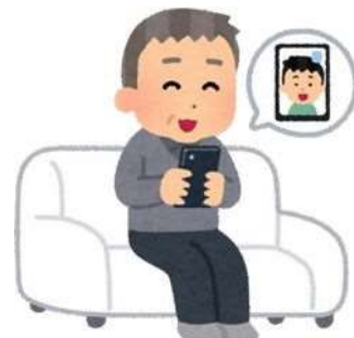
タブレットを使用したビデオ通話