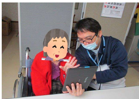
タブレットを使用したビデオ通話