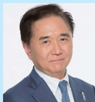
講演者 黒岩 祐治 ME-BYOサミット神奈川実行委員会 名誉実行委員長、神奈川県知事