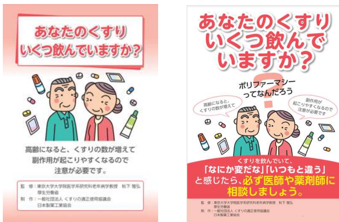
図1 一般社団法人くすりの適正使用協議会ウェブサイト「あなたのくすりいくつ飲んでいきますか」のパンフレット（図左）、ポスター（図右）のイメージ

https://www.rad-ar.or.jp/knowledge/post?slug=polypharmacy