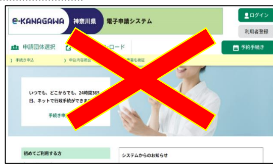
（e-kanagawa 電子申請（電子申請システム）の画面）