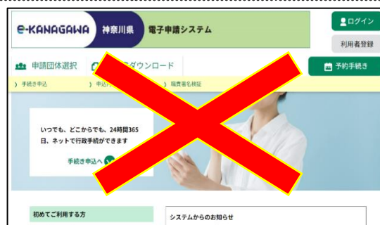
（ e-kanagawa 電子申請（電子申請システム）の画面 ）