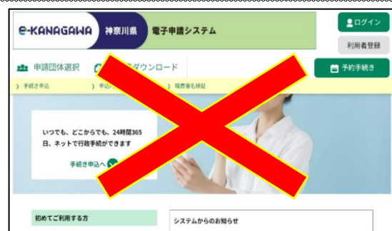
( e-kanagawa 電子申請(電子申請システム) の画面)