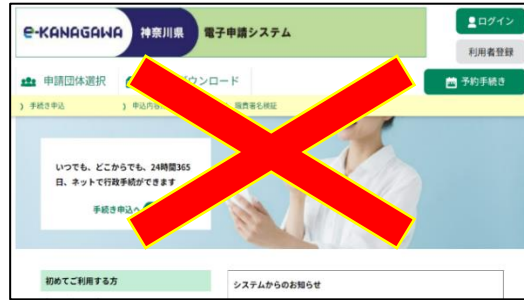
（e-kanagawa 電子申請（電子申請システム）の画面）