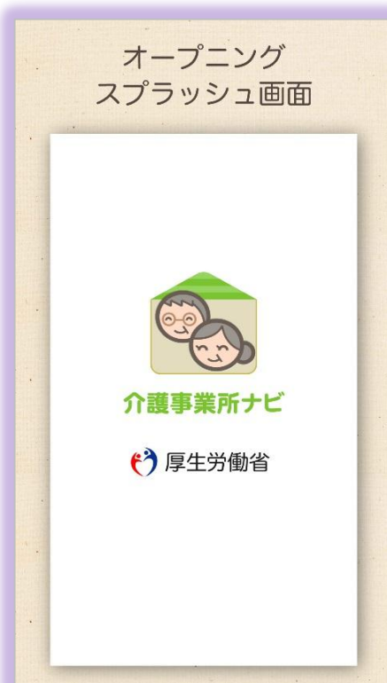
厚生労働省のクレジット