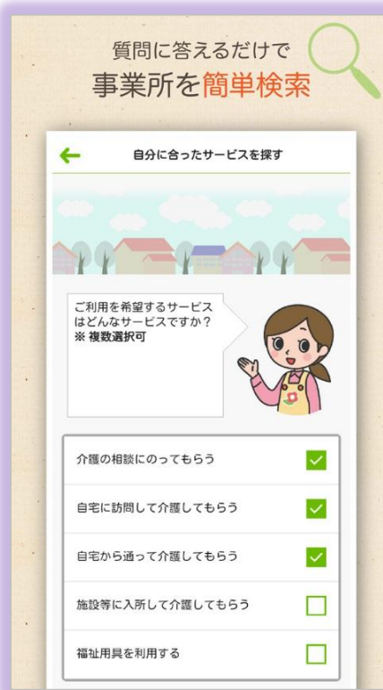
介護サービスに詳しくない方には質問形式で誘導