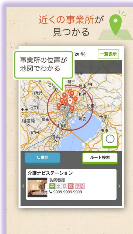
現在地からの距離や道順が分かる