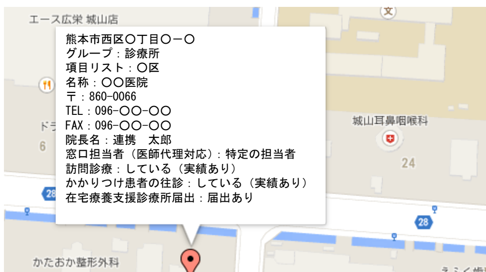
図表 1 医療資源マップ

医療資源マップ等は、作成後の更新作業が負荷になる。最新情報を提供していくことが求められる一方で、作業の手間から、それが実現できていないことが課題である。