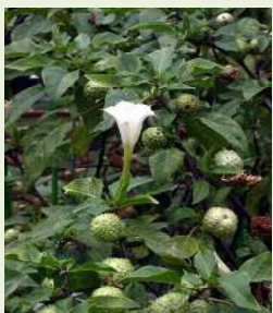
チョウセン アサガオの葉と花