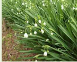
(スノーフレーク) スノーフレーク