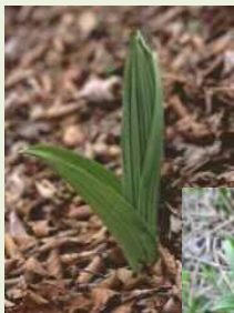
芽出し期 のバイケイ ソウ