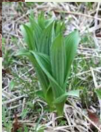
芽出し期 のコバイ ケイソウ